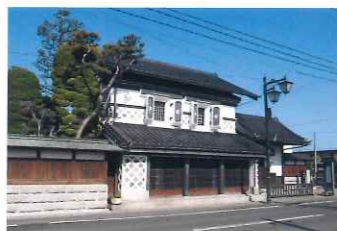
端午の節句に合わせ、角田館主石川氏家臣伝来の甲冑や武具などを展示します。