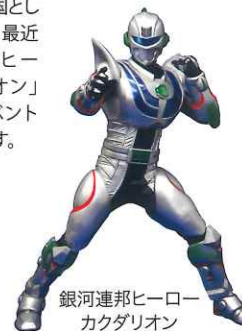
銀河連邦ヒーロー カクダリオン

銀河連邦とはJAXAの研究施設が縁で交流をはじめた自治体がユーモアとパロディの精神で組織している連邦国家で、角田市は2016年に7番目の共和国として加盟しました。最近では銀河連邦ヒーロー「カクダリオン」も角田市のイベントに登場しています。