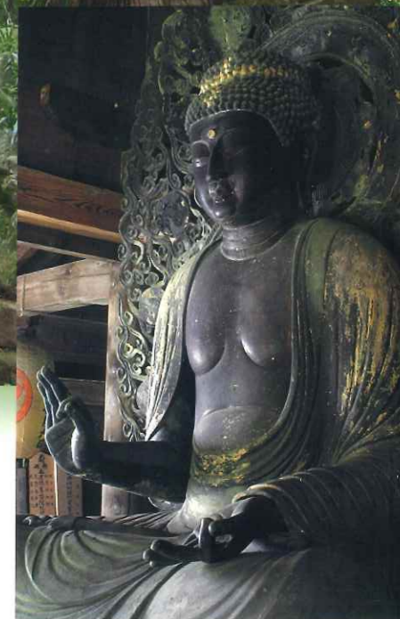
御本尊の阿弥陀如来坐像