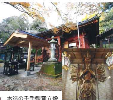
木造の千手観音立像

斗蔵山山頂にある斗蔵寺観音堂は奥州三十三観音第四番札所となっており、807年に坂上田村麻呂が建立し千手観音を安置したと伝えられています。観音堂には、御本尊の千手観音懸仏(県指定文化財・非公開)が安置されています。 ●斗蔵寺 TEL.0224-62-5341