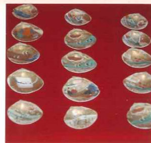
美しい絵柄の「貝合わせ」