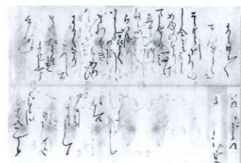
筆まめ武将といわれる伊達政宗公が、牟宇姫へ送った手紙