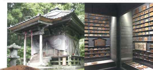
奉納されたむかで絵馬

福應寺毘沙門堂は、正徳四年(1714)に建立されました。この地域では、むかでの蚕の守り神であり毘沙門天の使いであるとして信仰され、養蚕安全を祈願して、むかでの絵や文字などが書かれた絵馬が、昭和50年代まで毘沙門堂に奉納され続けてきました。現存する最も古い絵馬は明和5年(1768)で、それら23,477枚の絵馬が2012年に県内初の国指定重要有形民俗文化財に指定されました。令和元年6月には絵馬の収蔵展示施設「むかでの絵馬館」がオープンしました。 ●福應寺 TEL.0224-69-2029