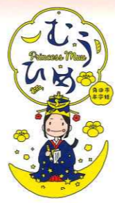
牟宇姫シンボルキャラクター むうひめ

角田市郷土資料館には、伊達家一門筆頭角田館主石川家に伝えられた伊達家ゆかりの豪華絢爛な雛人形が保存されており、毎年2月～3月に公開されます。高さ45cm、幅66cmの大きさの女雛も特徴的ですが、特別あつらえの雲竜紋の着物や伊達家の家紋が入った金梨地蒔絵の美しい雑道具も必見です。