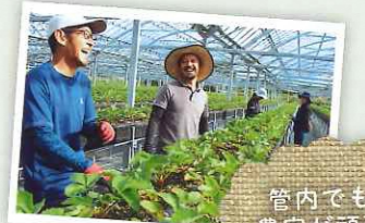
管内でも若手農家が頑張っています。

JA長崎せいひは、長崎県の西南部に位置し、長崎市、西海市、諫早市の一部、時津町、長与町の3市2町をエリアとしています。主な農産物は県内産の大半を占める温州ミカンと全国1位の生産量を誇るビワです。