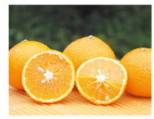
黄金スイートスプリング