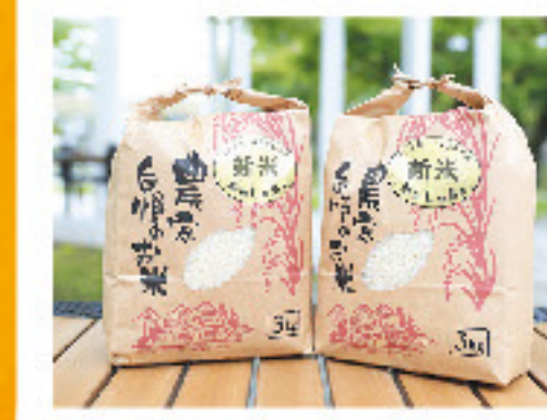
かかし米(精米ヒノヒカリ)