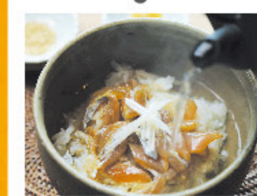
旬の天然魚さしみ漬け