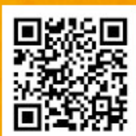
ふるさとチョイス