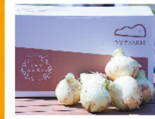
つなぎFARMサラダ玉ねぎ