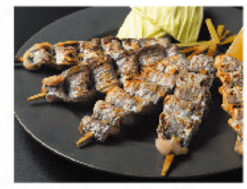
炭火焼太刀魚串5本セット