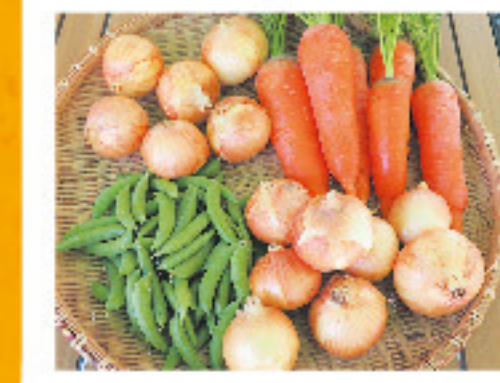
わらく農園野菜セット