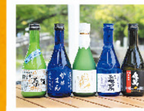
日本酒飲み比べセット