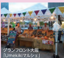
グランフロント大阪 「Umekikiマルシェ」

三田市は、兵庫県南東部、神戸・大阪の大都市近郊にありながら豊かな自然に恵まれた地域です。三田米をはじめ野菜や果樹、畜産物等、多様な特産物を大消費地に供給。地産地消の推進にも積極的に取り組んでいます。親方農家による農業研修など市独自の支援策が充実しており、若手の新規就農者やベテラン農家も多く、就農初期に相談しやすい環境があることも魅力です。自然と都市のバランスが揃ったこのまちで、一緒に農業を志す方を応援します。