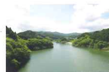
富士しゃくなげ湖(嘉瀬川ダム)