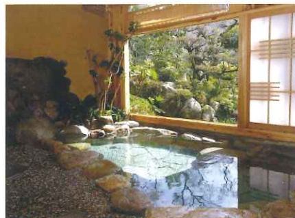
古湯・熊の川温泉