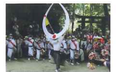
市川の天衝舞浮立