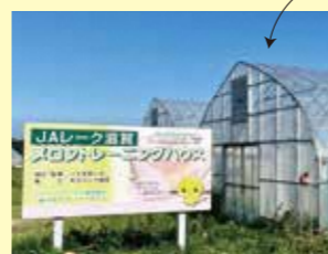
メロントレーニングハウス

実践的な農場実習から基礎知識や栽培技術を習得できます。また、研修期間中に「就農計画の作成」「施設整備」などの就農に向けた準備を行います。(関係機関がサポート)