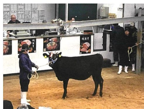
県内家畜市場へ子牛上場