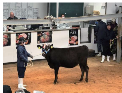
県内家畜市場へ子牛上場